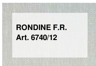
RONDINE F.R. Art. 6740/12