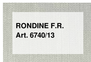
RONDINE F.R. Art. 6740/13